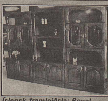
Íslensk framleiðsla: Royal