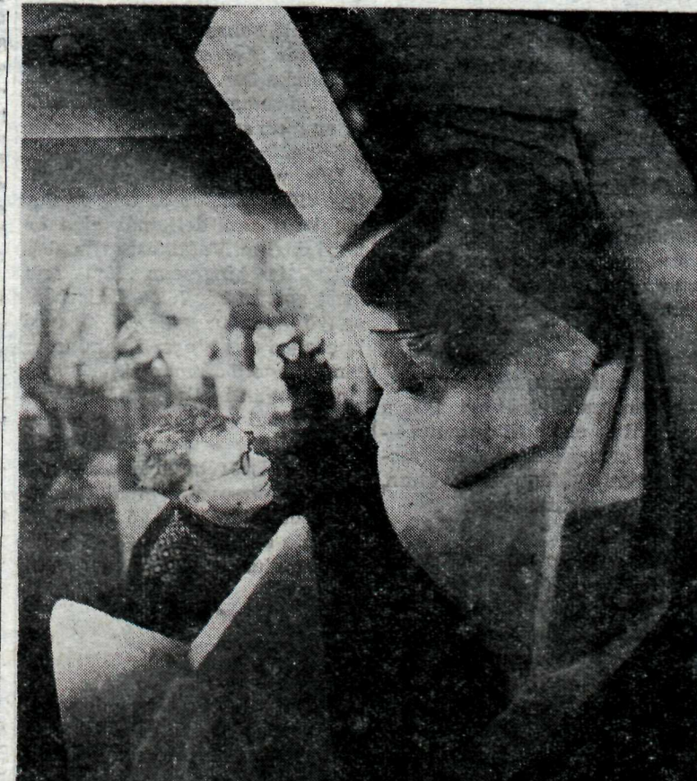
Ásmundur Sveinsson: — Ekki sjálft motivið, heldur hið abstrakta gefur verkinu gildi.