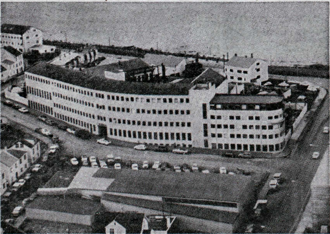
Frá sögusýningunni um Vélsmiðjuna Héðin h.f.

Smiðja Bjarnhéðins mun hafa verið mjög fábrotin. Hún var í 60 fermetra húsnæði og var vélakosturinn lítill, tveir rennibekkir, knúnir oliuhreyflum, handsnúin bor vél og fótstigin smergelskífa. Starfsmenn Héðins voru fjórir að tölu, er smiðjan hóf starfsemi sína, en tveimur mánuðum síðar voru þeir orðnir sjö. Vélum og áhöldum fjölgaði jafnt og þétt og 1926 var keypt fyrsta rafsuðutækni, sem Íslendingar eignuðust. Það var í eigu Héðins.