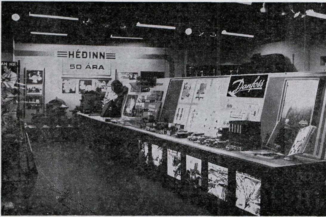
Byggingar Vélsmiðjunnar Héðins h.f. við Seljaveg.